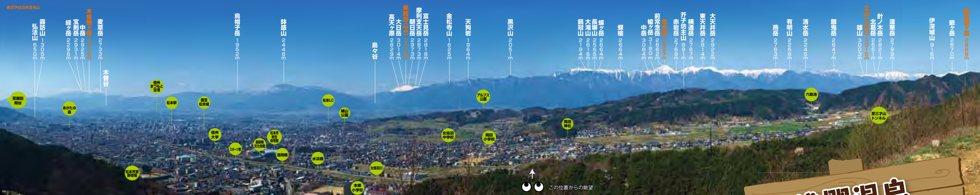
●展望台から望む景色